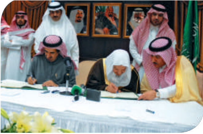
جامعة الملك سعود

العمل على إعداد البحوث والدراسات المشتركة وتجهيز استبانات استطلاع الرأي والتعاون في مجال المراجعة العلمية واللغوية والتحريرية للمواد العلمية في مجالات الحوار والترجمة الدقيقة للغات الحية، وتنفيذ برامج تدريبية فعالة لبناء ثقافة الحوار والترابط الاجتماعي للجميع وللتغلب على معوقات انتشار ثقافة الحوار والتسامح والوسطية والاعتدال، والتعاون بين الطرفين في لقاءات الوفود المعنية بقضايا الحوار والثقافة السعودية لكل منهما.