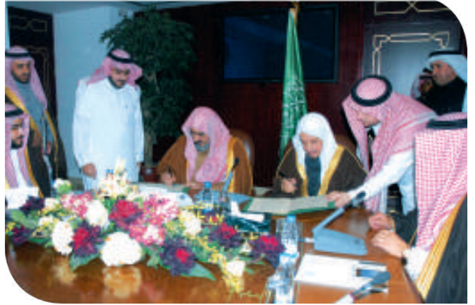
جامعة الامام محمد بن سعود الإسلامية